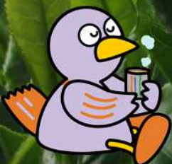
埼玉県マスコット 「コバトン」