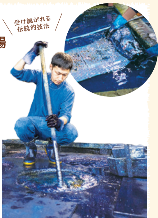
受け継がれる伝統的技法

「藍の色が、心をそっと優しく包んでくれる」場所。創業は明治39年。伝統的な藍染めと型染の技法ではんてんや祭衣装などを制作する相澤染工場。約40個の藍甕が土中に埋め込まれています。美しい文字入れ、きめ細かな型付け、生きた藍と対話しながら進める染め作業。昔から今へ確かに伝統は引き継がれています。