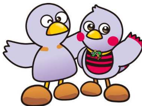
埼玉県のマスコット 「コバトン・さいたまっち」