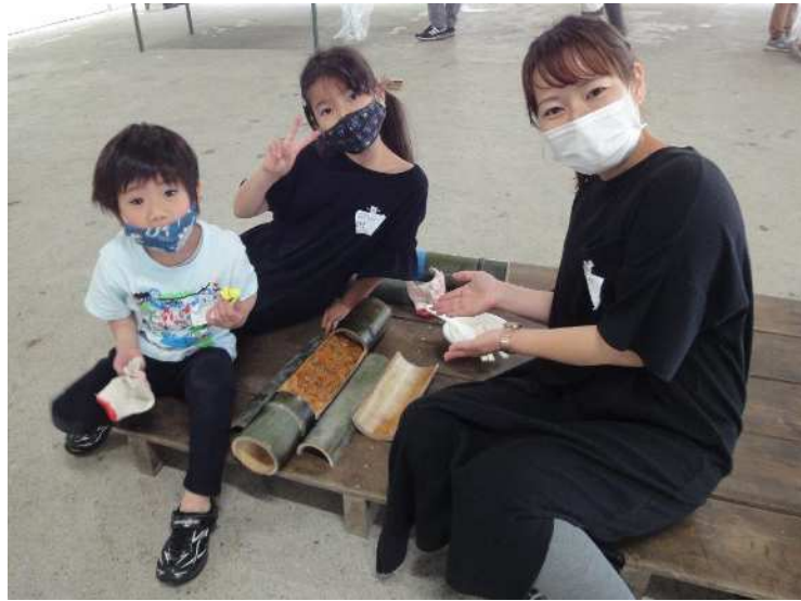
(竹筒ご飯づくり 小川げんきプラザ)