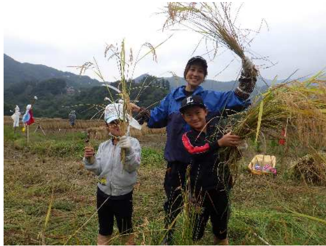
寺坂棚田で米作り（名栗げんきプラザ）