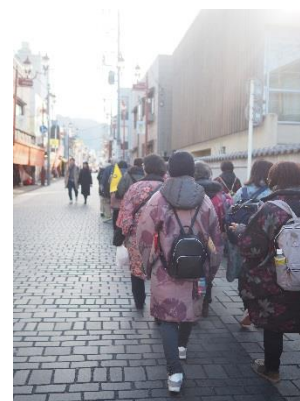
主催事業「秩父銘仙を知る旅～時代を紡ぐ絹の糸」