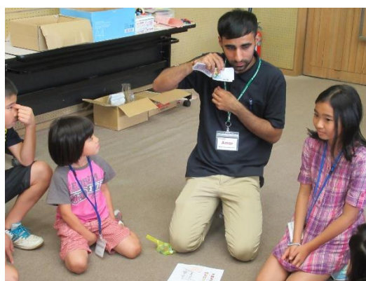
主催事業「イングリッシュサマーキャンプ」