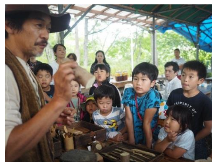
主催事業「ふれあいファミリーキャンプ」