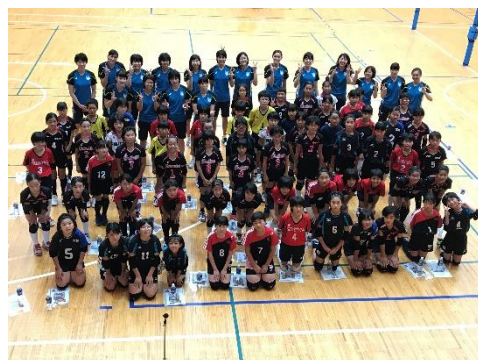
主催事業「東京2020公認プログラム プロ選手から子どもたちへ！バレーボールで繋ぐ未来への道」