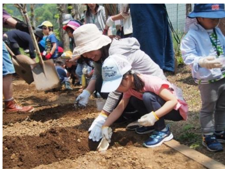
主催事業「春だ！ちびっこ大集合！」