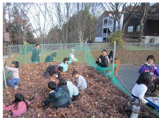
主催事業「落ち葉のプール・焼きいも・ドラム缶ピザ作り」