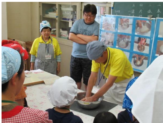
主催事業「はじめての手打ちうどん体験」