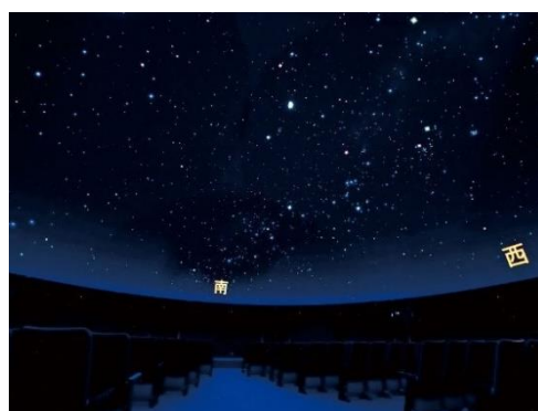
生声解説が魅力のデジタル式プラネタリウム