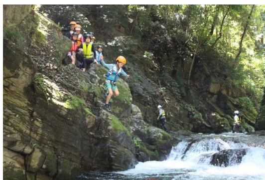
主催事業「神川サマーキャンプ 川遊び②」