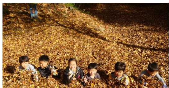
主催事業「落ち葉で遊ぼう！ ～集めて遊んでホッカホカ～」