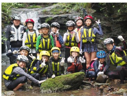
主催事業「長瀨ぼうけんクラブ(春・夏)3」