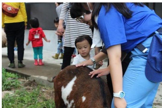
主催事業「森のようちえん かみかわおさんぽくらぶ 動物とふれあおう」