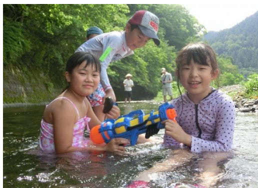
主催事業「浅瀬釣り・川遊び・BBQ体験」