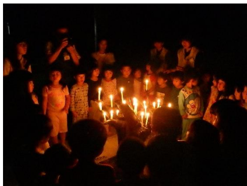
幼児だけのお泊り主催事業「もりっこお泊り会」