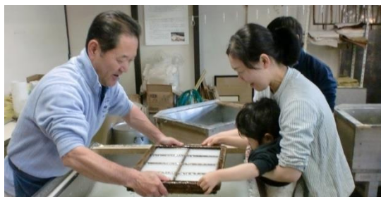
主催事業「バンガローに泊まろう！ ～和紙づくりと山小屋体験～」