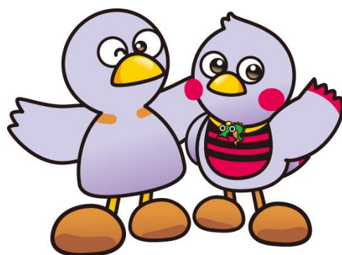
埼玉県のマスコット 「コバトン・さいたまっち」