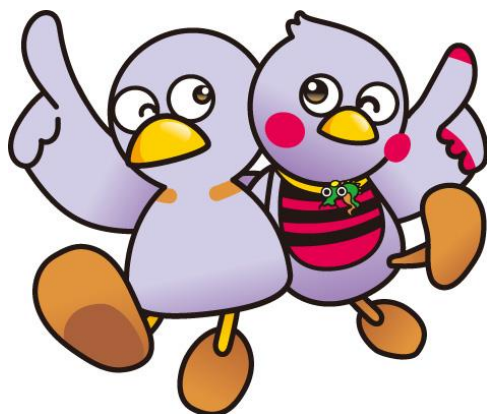
埼玉県のマスコット 「コバトン・さいたまっち」