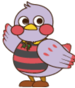
埼玉県のマスコット「さいたまっち」