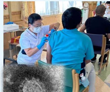
新型コロナウイルスの電子顕微鏡写真像