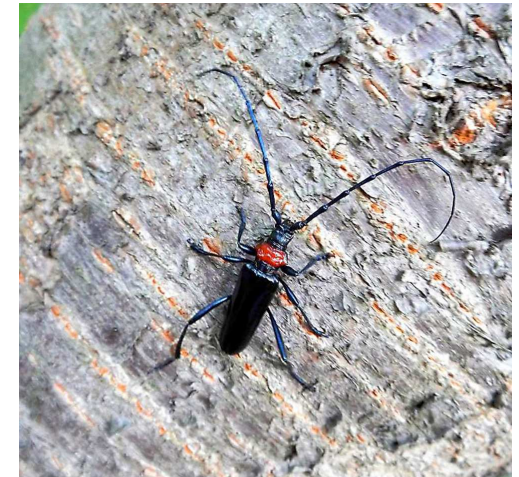
写真4-6 クビアカツヤカミキリ