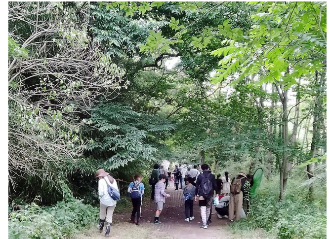
写真4-3 ミドリシジミを見る集い

令和4年度は、キックオフミーティング、ミドリシジミを見る集い、いきものサイエンスカフェ、いきものフォーラムを開催し348人に参加いただきました。