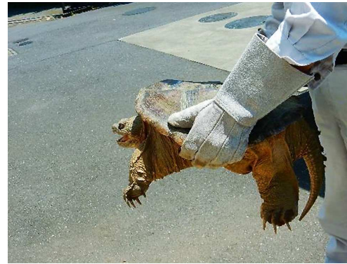
写真4-5 カミツキガメ

「特定外来生物による生態系*等に係る被害の防止に関する法律」に基づき特定外来生物に指定されている生物を駆除することにより、生態系、人の生命・身体及び農林水産業等への被害防止を図りました。県内において、被害防止対策が必要な生物として、令和4年度は8市町でカミツキガメ39頭を駆除しました。また、クビアカツヤカミキリについて、22市町村598か所で被害が確認され、市町村と連携し、薬剤や伐採による防除を実施しました。