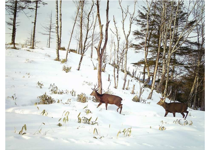
写真4-4 県境付近におけるニホンジカ

さらに、治療後の鳥獣が再び自然に復帰できるまでの間、保護飼養を依頼するボランティアの確保に努め、個人及び法人で合計61者（令和4年度末時点）が登録しています。