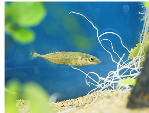
写真4-1 ムサシトミヨ