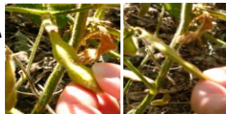
正常さや 不稔さや

大豆: 高温・干ばつの影響で十分に成熟しない 豆が発生 被害面積 307ha(速報値)