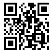
動画の QR コード