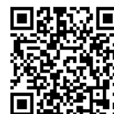
ホームページの QR コード

URL : https://www.toshiseibi.metro.tokyo.lg.jp/kiban/gouu_houshin/kyuutokenshi.html