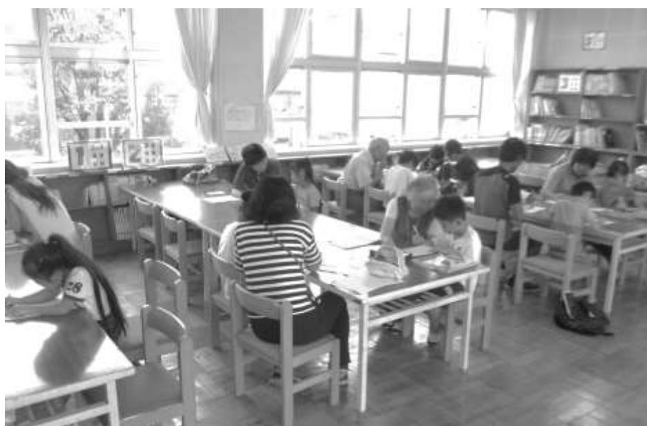
夏休み算数教室 狭山市立入間川東小学校