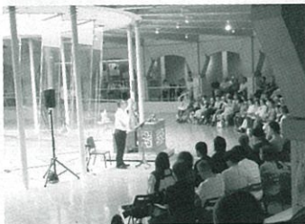
無料ミニコンサートの様子

芸術の秋を彩の国さいたま芸術劇場や埼玉会館で感じてみませんか?皆様の御来場をお待ちしています。