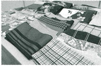
選べる数種類の浴衣 参加者には巾着をプレゼント!

八潮市は、住民の約3%が外国籍住民という県内でも上位の国際色豊かな街です。 そこで、日本の伝統衣装である浴衣を通して日本文化に触れ、交流の場を提供することを目的に、毎年7月に行われる「八潮夜市」の会場で浴衣の着付けを行っています。(平成29年度は悪天候のため、中止となりました。)