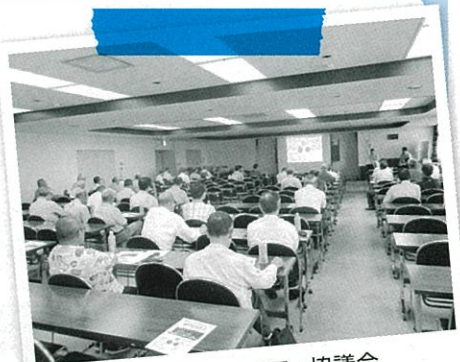
行田市コミュニティ協議会 講演会の様子

お申込みの方法・留意事項や講座テーマの詳細については県HP https://www.pref.saitama.lg.jp/a0301/demae/ または県地域振興センター、広聴広報課等で配布しているパンフレットを御覧ください。