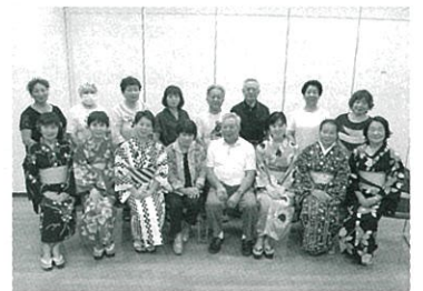
協議会委員の皆さん