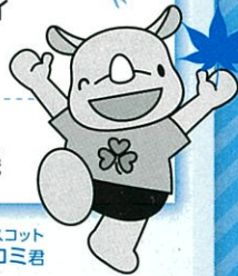
彩の国コミュニティ協議会マスコット サイコミ君