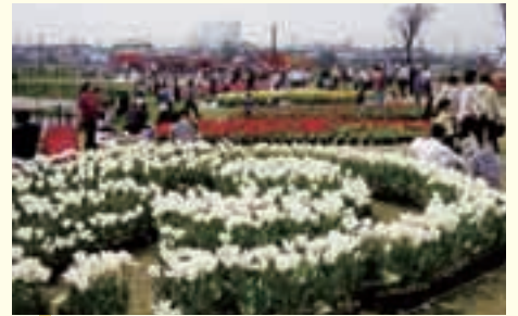
巨大チューリップガーデンへようこそ!