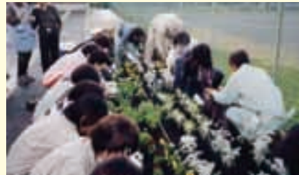
「花いっぱい緑いっぱい県民運動」への取組