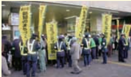
「防犯のまちづくり」への取組