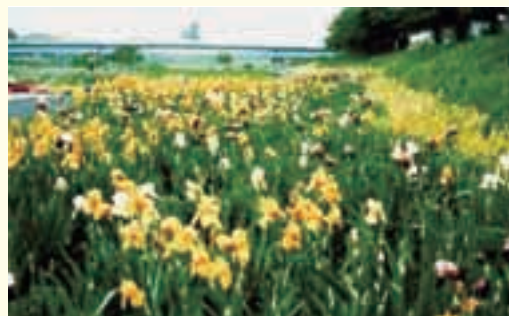
のり面下花畑のジャーマンアイリスが一面に開花

ホームページ http://www003.upp.so-net.ne.jp/nozu/flowers.html