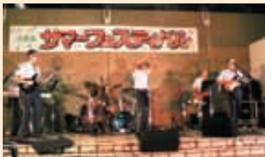
サマーフェスティバル 横田基地音楽隊野外ライブ

例えば、商店街の近辺には丸広、コナミスポーツクラブ等の大型店がありますが、大型店と近くの商店街との共同事業として「いるまんなか協議会」をたちあげ、スタンプラリーやイラストマップの発行などを行っています。