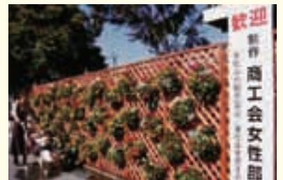
駅から市役所までハンギングバスケットロードとして飾り付け