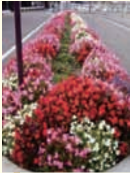
駅南タクシー乗り場ロータリーに、見通しよく、はなやかに植えています。