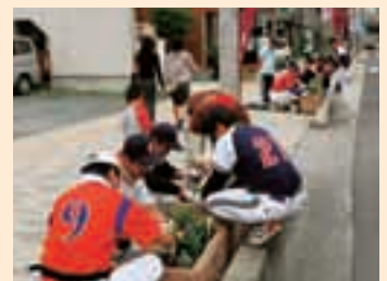
花と緑と香りのみちづくり事業 植栽作業

8月にはサマーフェスティバル、12月にはクリスマスバザールが行われます。みなさんも足を運んでみてください！アポポ商店街振興組合ホームページ http://www.apopo.net/