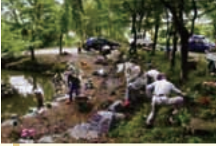
山からの湧水で水もたまり、池を回る道もでき、アジサイを植えていく