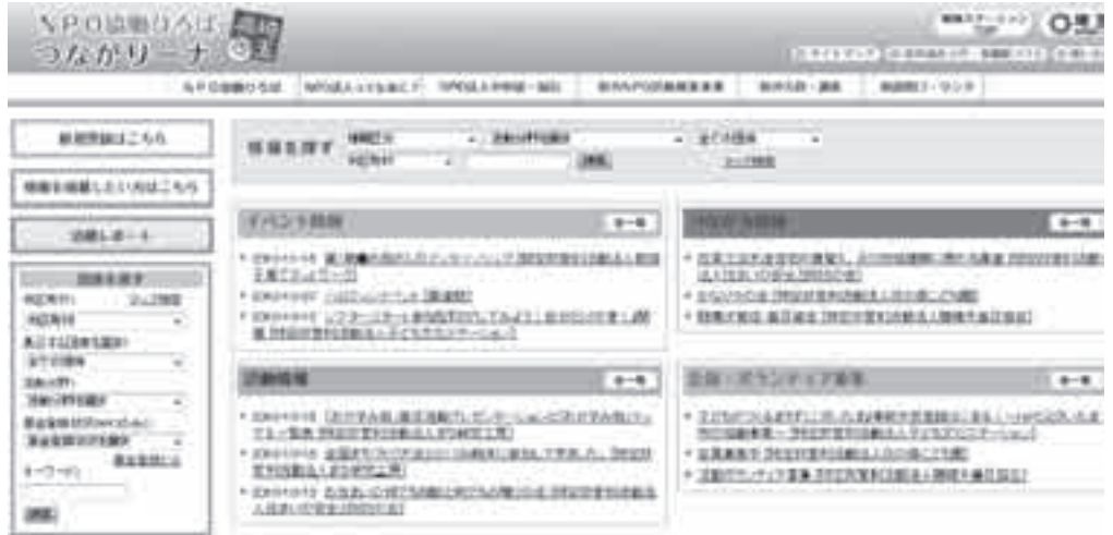
「つながリーナ」トップページ