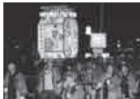
北本まつりの様子

また、北本市最大のイベントでもある「北本まつり・宵まつり」に向け、地域の方々力が合わせ思い思いの特色ある「ねぶた」を作成。まつり当日は8地域委員会の他、市内各団体も含め約25～30基前後のねぶたが勇壮に曳き回され、晩秋の北本の夕暮れを鮮やかに彩ります。昨年からは、まつりに向けて笛や太鼓の練習を子ども達とともに行う地域委員会もあられ、団体をあげて故郷の祭を盛り上げています。