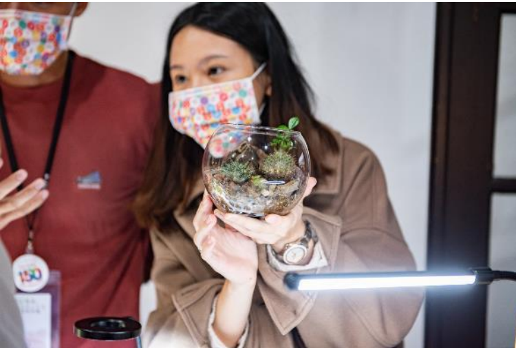
■開催の様子（会場内 「種下」 「東喜舗」）