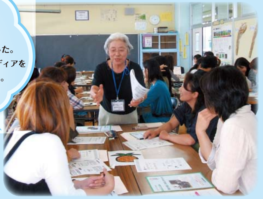
深谷市立岡部小学校での「親の学習」

ふだん子どものことについて ゆっくり話す機会がないので とてもよかったと思います。 私と同じ悩みを持っている方もいました。 子育てについてさまざまな意見、アイデアを 聞くことができ、参考になりました。 (保護者の感想)