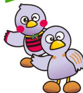
さいたまっち & コバトン