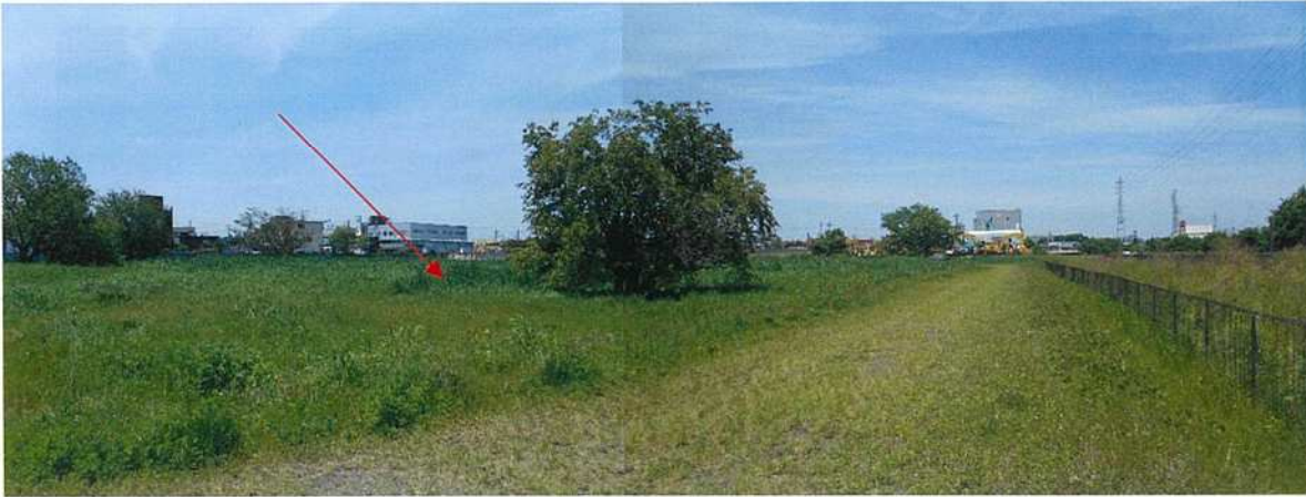
対象不動産の現況写真：①