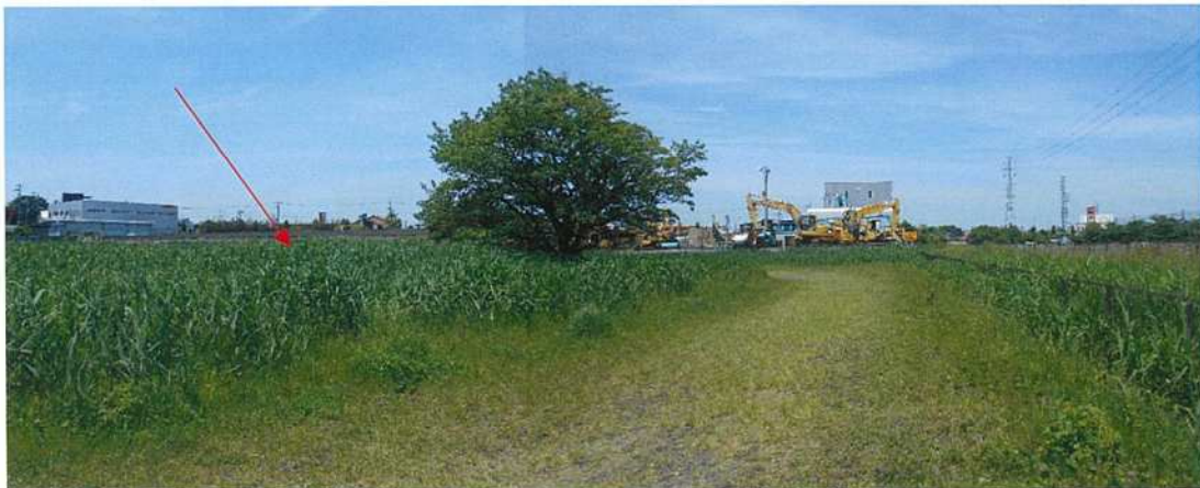
対象不動産の現況写真：②