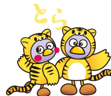
埼玉県のマスコット 「さいたまっち」&「コバトン」