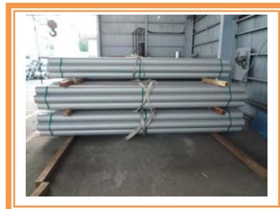
ステンレス管 完成品

特殊鋼管では上下水道をはじめ、各種現場で使用する配管や製缶プレハブ加工を行っています。素材を知り尽くしたステンレスパイプメーカーならではの迅速かつ安心加工をお約束いたします。