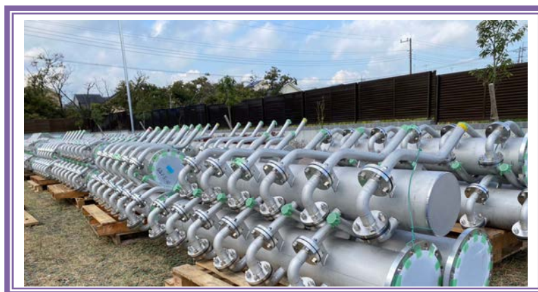
プレハブ加工管 完成品