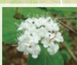
山野草を楽しみながら、雑木林の中を歩きます。