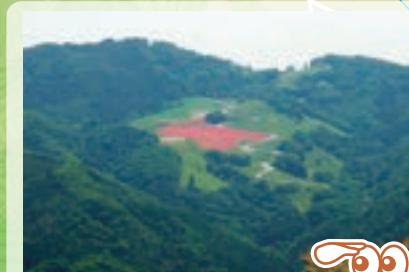
東展望台 大霧山や秩父高原牧場のポピーを見ることができます。