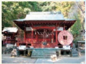
聖神社 和銅元年に創建され、和同開珎が祀られていることから「銭神様」と呼ばれます。