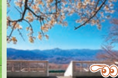
入口展望台 武甲山・秩父市街地が見下ろせます。

関東ふれあいの道⑥ 花の美の山公園を訪ねるみち 親鼻～美の山：3.7km (登り)1:40 (下り)1:10