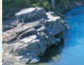
親鼻橋下の紅簾石片岩の露頭 (名勝・天然記念物)