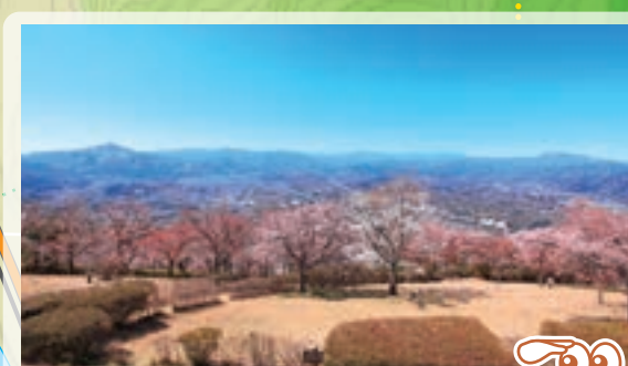
山頂展望台 武甲山・両神山や秩父盆地を見渡せる絶景ポイント。ジオパークツアーの出発点。