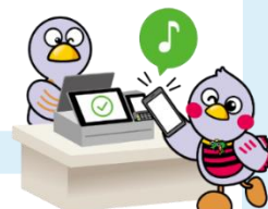
埼玉県マスコット コバトン&さいたまっちゃん