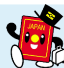
パスポートイメージキャラ パスポくん