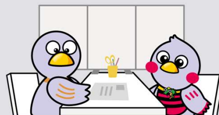
埼玉県マスコット「コバトン&さいたまっち」