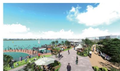
大相模調節池の整備イメージ