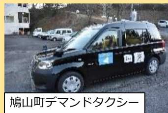
鳩山町デマンドタクシー

概要 鳩山町の人口集中地域である鳩山ニュータウン地区に整備した、はーとんスクエア及び鳩山町コミュニティ・マルシェを中心に、地域の拠点となる機能を設置・拡充して都市機能の集約化を目指す。