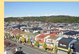
鳩山ニュータウン中央 商店街