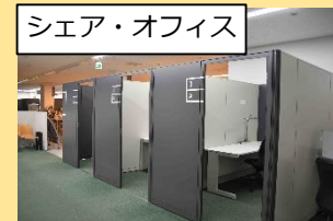
シェア・オフィス