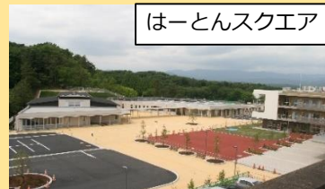
はーとんスクエア