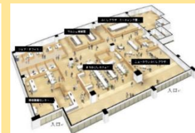
鳩山町コミュニティ・マルシェ