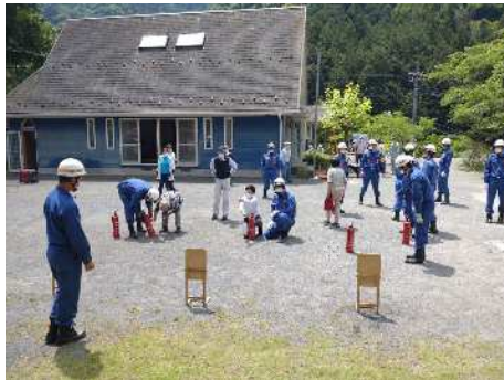
初期消火訓練(秩父市)