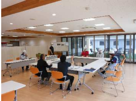
情報収集(東松山市)