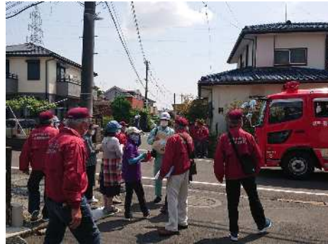
避難経路の確認(坂戸市)