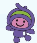
上尾市マスコット 「アッピー」