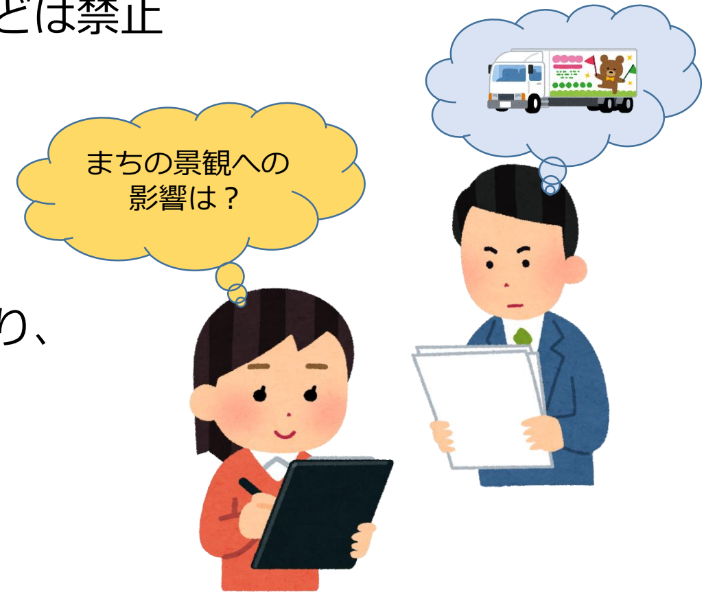
デザイン審査のイメージ