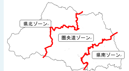
本計画におけるゾーン区分図