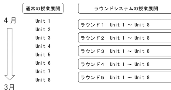
1年間の授業の流れのイメージ

また、「教科書の学習」と「リアルな使用場面」の2つのバランスを意識して授業を行っている。到達目標や定着状況を逐次モニター・分析し、生徒の英語力に磨きをかけていく。ストーリーテリングをはじめ、「人ごと」について話したり、書いたりする活動が多くなりがちであるが、実生活の中では、物事を「自分ごと」として捉え、「自分の思いや考え」を発信していくことがとても重要である。生徒が自分と向き合い、英語で自分を語れる時間を設けることを意識したい。