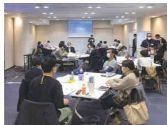
2022.9.8 令和4年度第1回埼玉県独自DMAT養成研修(1日目)

専門的な訓練や研修の実施や関係機関と医療機関の連携を県職員がサポートし、あらゆる危機がいつ、どこで起きても被害を最小限に抑えられる社会を目指します。