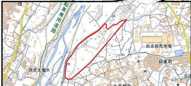
川越増形地区産業団地