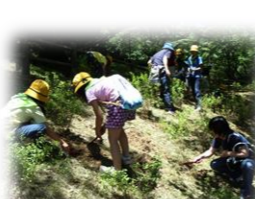
森づくり活動（越生町）