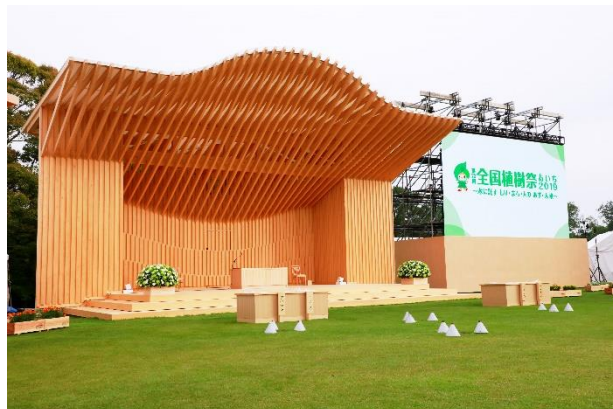
県産木材を活用したお野立所 (第70回全国植樹祭〔愛知県〕)