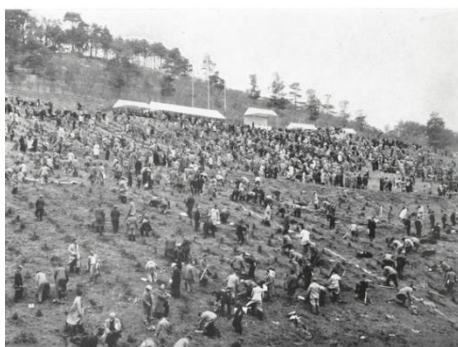
参加者による植樹風景