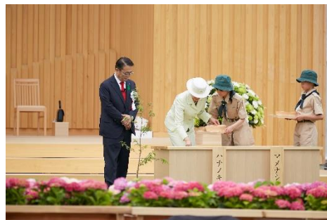
皇后陛下お手播き (第70回全国植樹祭〔愛知県〕)