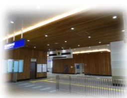
駅自由通路（幸手市）