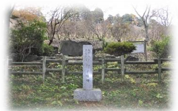
第10回全国植樹祭記念碑