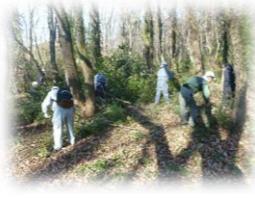
里山・平地林（狭山市）