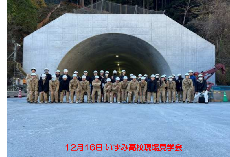
12月16日 いずみ高校現場見学会