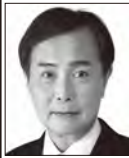
かわい たかのり 国民民主党 参議院国政対策委員長 ムアにしません 汗と税!