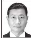
たabei りょうへい 元参議院議員 表現の自由を守る、 日本V字回復やったるい