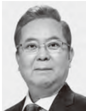
よこやま 信一 現2 前復興副大臣。北海道大学大学院博士課程単位取得。水産学博士。62歳。

公明党はこの7人をはじめ参院選比例区に17人を公認しています。 ※年齢は選挙期日現在