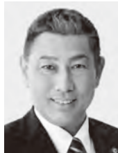
くまの せいし 現1 前農林水産大臣政務官。愛媛大学大学院博士課程修了。医学博士。放射線科専門医。57歳。