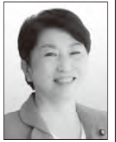
社民党党首 福島みずほ 希望は憲法