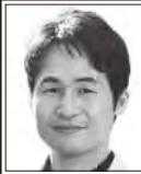
うえまつ せいわ 医師 助けよう 正しい医療 やめさせよう 詐欺医療