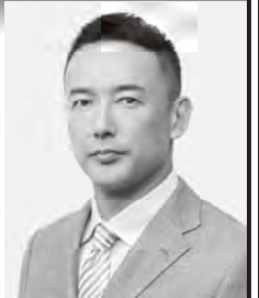
れいわ新選組 代表