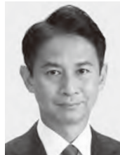
たに あい 正明 現3 元農林水産副大臣。党参議院幹事長。京都大学大学院修士課程修了。49歳。