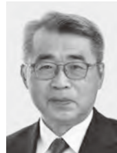
みやざき まさる 現1 前環境大臣政務官。党環境部会長。埼玉大学工学部卒。64歳。