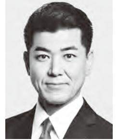
立憲民主党 代表 泉 健太