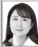
やだ わか子 国民民主党 副代表 あなたと助けば、 未来は変わる。