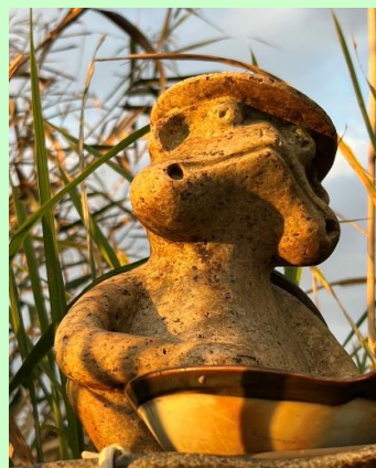
今日も 良い日だったなあ 川崎 信幸