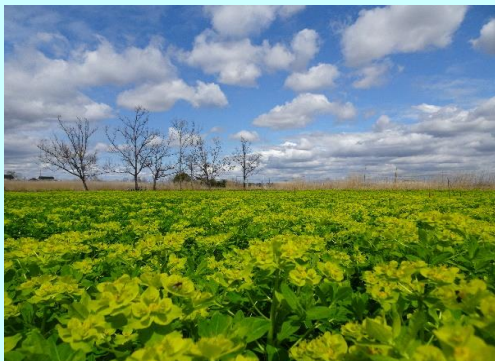
花の色、雲の影 藤原 正宜