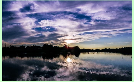
黒浜沼の夕景 花田 寛子