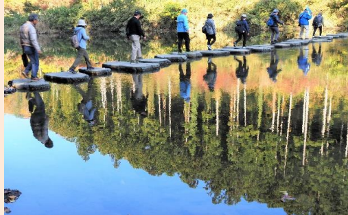
彩りを渡る 船塚 和雄