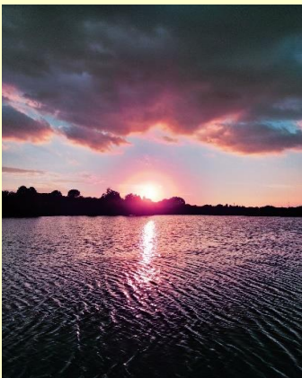
真夏の夕焼け 八須 陽大