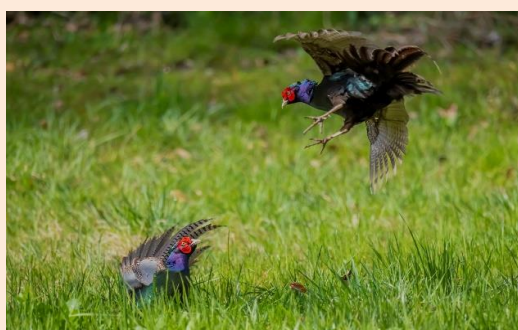
Green Pheasant 小堀 文彦