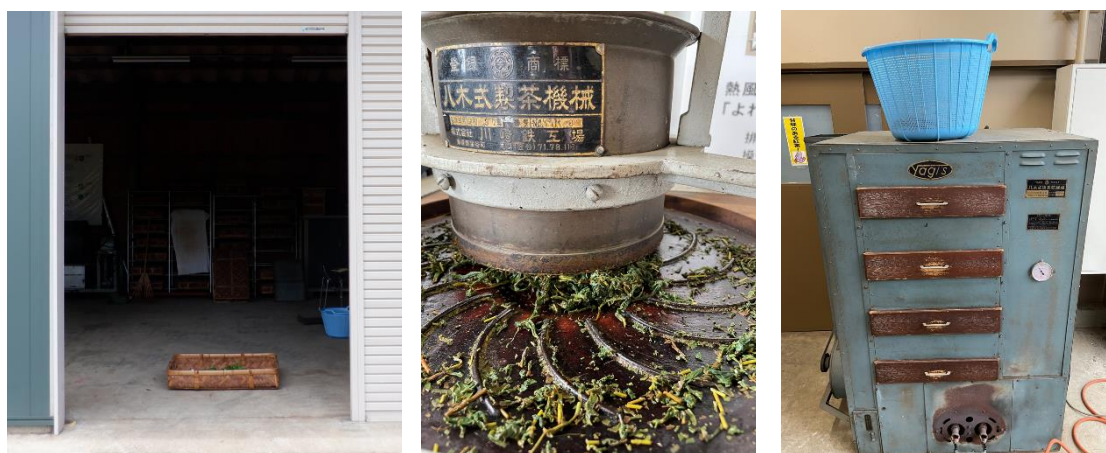
図2 茶業研究所における紅茶試験製造工程(秋冬番茶)

(日本茶輸出促進協議会「令和4年度農林水産省補助事業輸出用茶残留検査事業実施報告書より検出数が多い順に一部抜粋。全国から募集した100点中の値。)