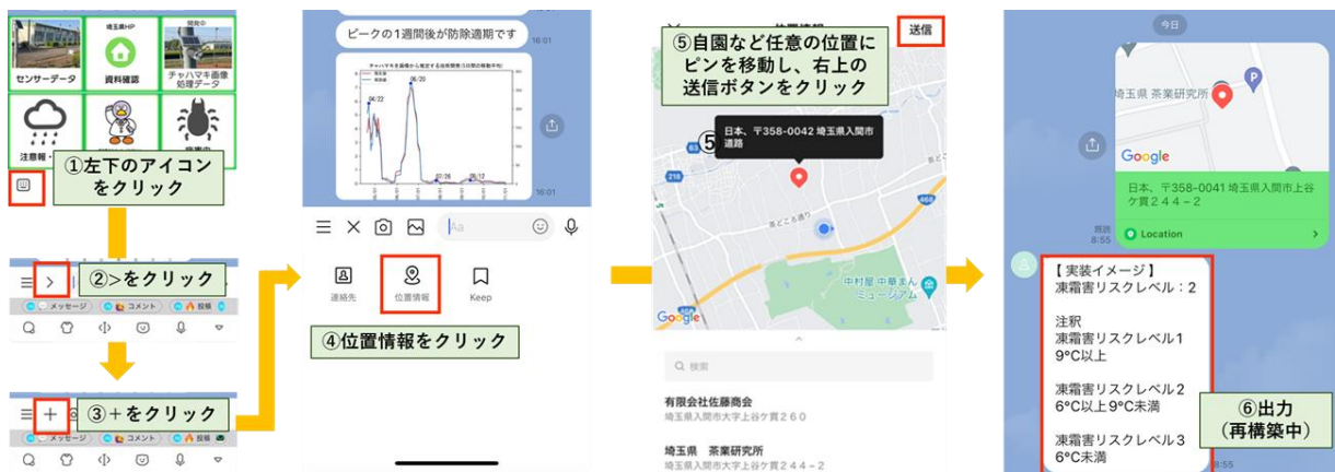
図3 5mメッシュの最低気温推定モデルをLINE™アプリと連動

※直線は有意水準5%のMann-Kendall検定で傾向が認められたKendall-Theil Robust Lineを表す。 傾向が認められなかった5日平均の展開葉枚数は直線を省略した。