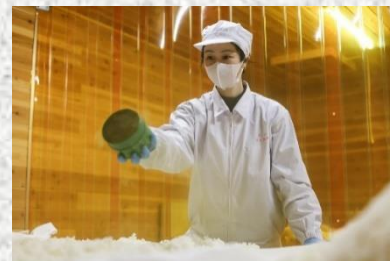
女性杜氏の酒造りの様子