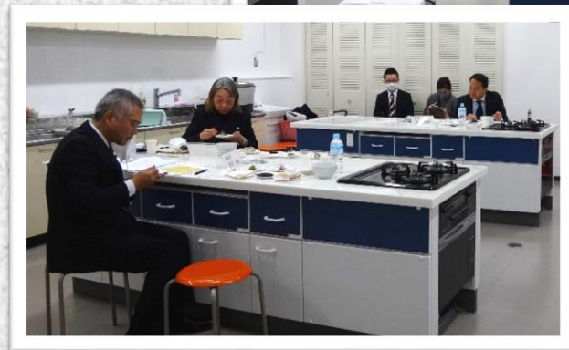
審査委員会の様子