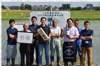
JAIいるま野さけ武蔵生産組合