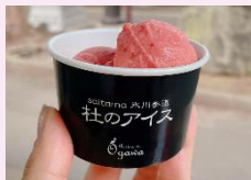
かおりんのジェラート (パニノテカ ベリカーノ)