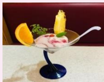
コラーゲン入り輪糖プリン フレッシュフルーツ添え (魔王飯店)