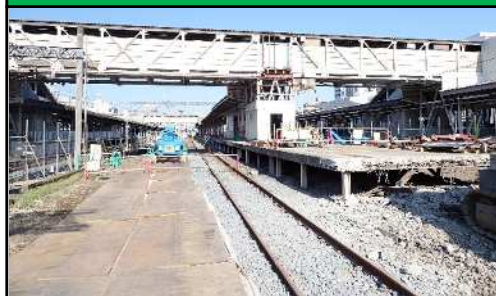
伊勢崎旧下りホーム解体状況