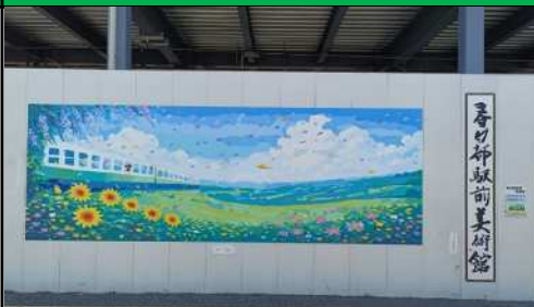
絵画 (作：日本工業大学の美術部の学生)