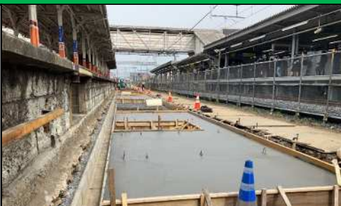
野田仮ホーム基礎構築状況