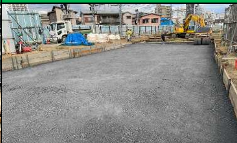
野田線89号踏切道付近路盤整備状況