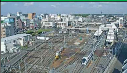
春日部駅構内工事施工状況