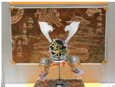
展示作品：銅板打出し絵画と戦国兜