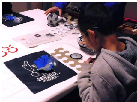
ものづくり体験：鉄板サッカーボールづくり