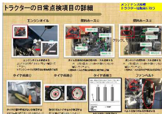
(写真：マニュアル (トラクター日常点検))