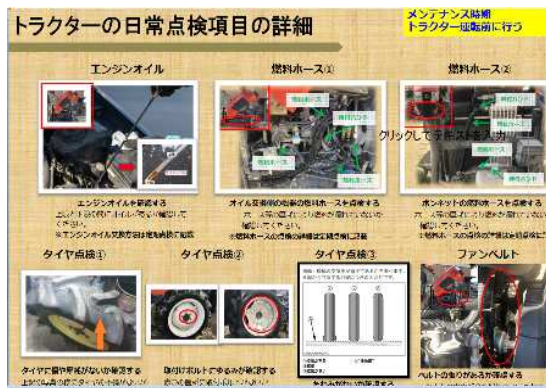
(写真：マニュアル (トラクター日常点検))