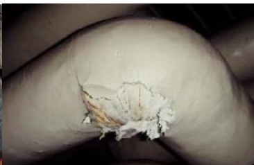
エルボ部に使用 石綿含有保温材