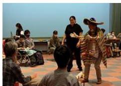
障害のある方向け ワークショップ開催