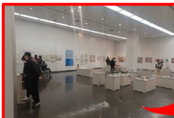
障害のある作家の アート作品の展示