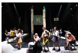
障害のある方々の 舞台公演の実施