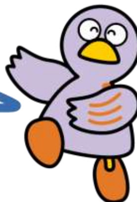
Hình ảnh biểu trưng của tỉnh Saitama Kobaton