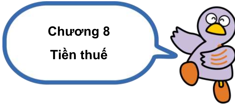
Hình ảnh biểu trưng tỉnh Saitama Kobaton