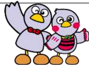
Hình ảnh biểu trưng của tỉnh Saitama Kobaton • Saitamacchi

Giới thiệu hoạt động của người nước ngoài tại tỉnh Saitama” gồm 11 ngôn ngữ Tiếng Nhật, tiếng Anh, tiếng Trung Quốc, tiếng Hàn Quốc, Tiếng Triều Tiên , tiếng Tây Ban Nha, tiếng Bồ Đào Nha, tiếngPhilippin, tiếng Việt và tiếng Thái, tiếng Nepal (một phần), tiếng Indonesia (một phần) http://www.pref.saitama.lg.jp/a0306/tabunkakyousei/sei/seikatsu-guide.html Trang chủ phòng quốc tế ban đời sống người dân tỉnh Saitama