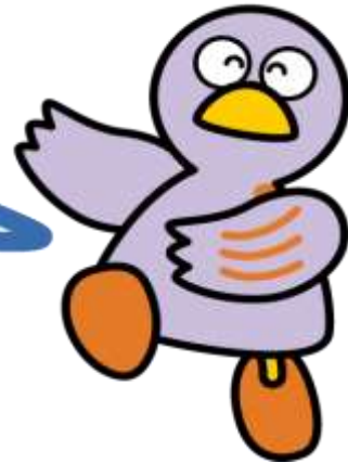
Hình ảnh biểu trưng của tỉnh saitama Kobaton

Chế độ quản lý lưu trú Chế độ sổ bộ cơ bản trú dân Chế độ mã số định danh cá nhân