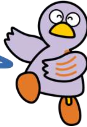
Hình ảnh biểu trưng của tỉnh Saitama Kobaton