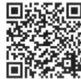
埼玉县警察 外国驾照转换

申请前，请在驾驶执照中心接受材料审查。（材料审查需要在埼玉县警察署的网页进行线上预约。我们不受理没有接受材料审查者的驾照更换申请。）