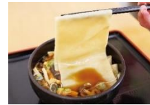
川幅うどん（鴻巣市）