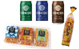
抽選で当たる県産品（一例）